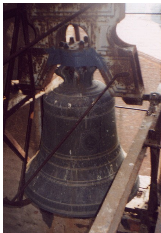
Campana del 1816(II) di Cerea