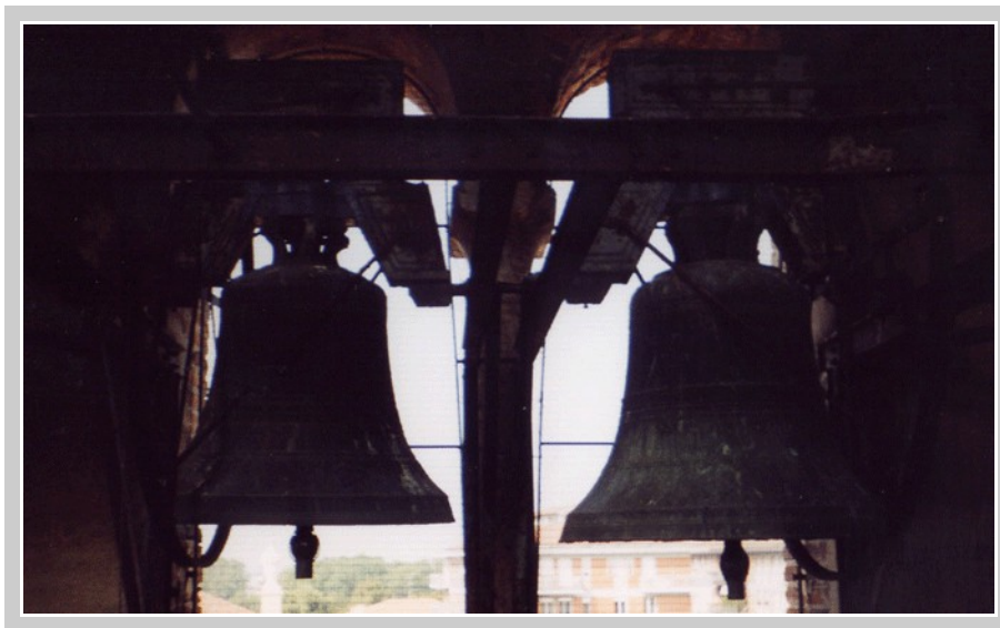
II e III campana di Cerea