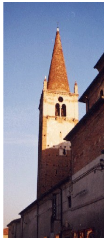
Campanile della chiesa di S. Maria Assunta in Cerea