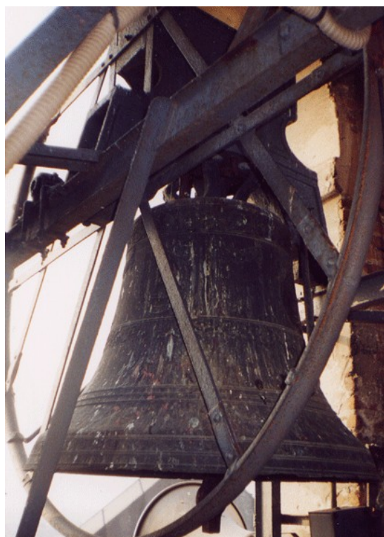
Campana del 1815 (V) di Casaleone

Legenda: r. = rifusa, a. = aggiunta, s. = sostituita