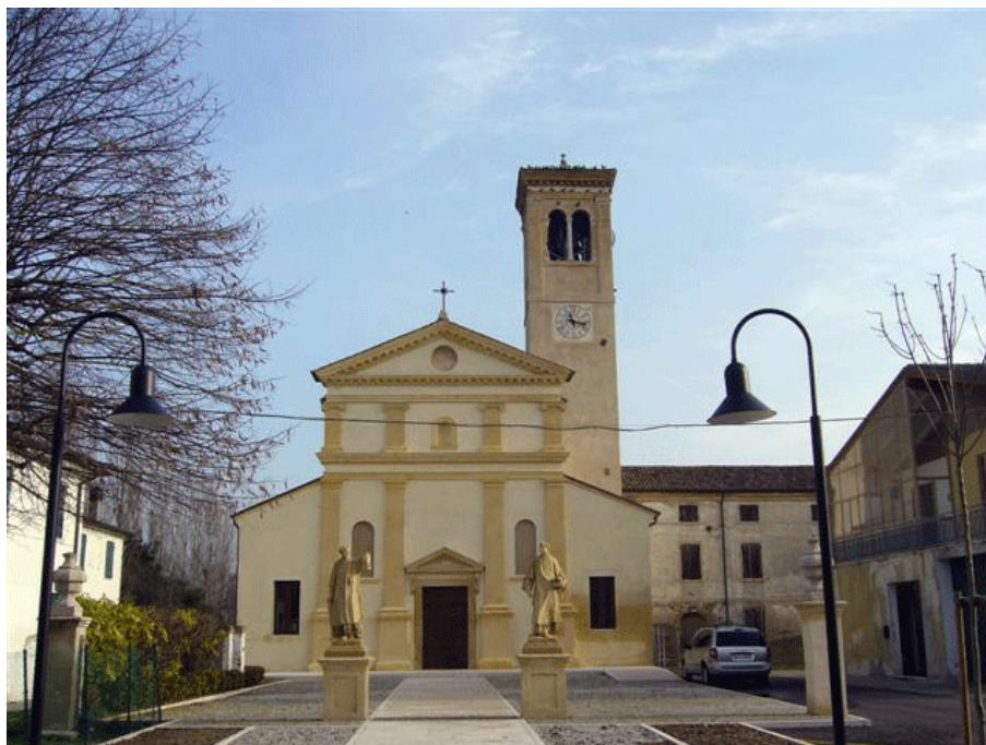
Ex - chiesa parrocchiale di Concamarise

Legenda: r. = rifusa, a. = aggiunta, s. = sostituita