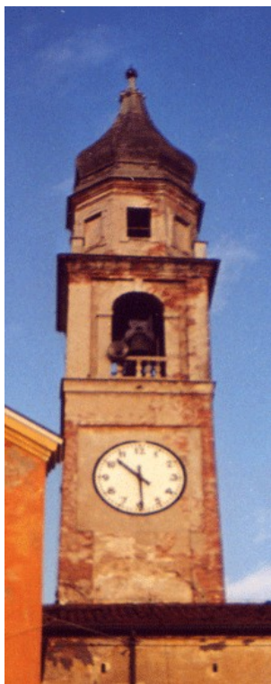
Campanile della chiesa di S. Biagio in Casaleone