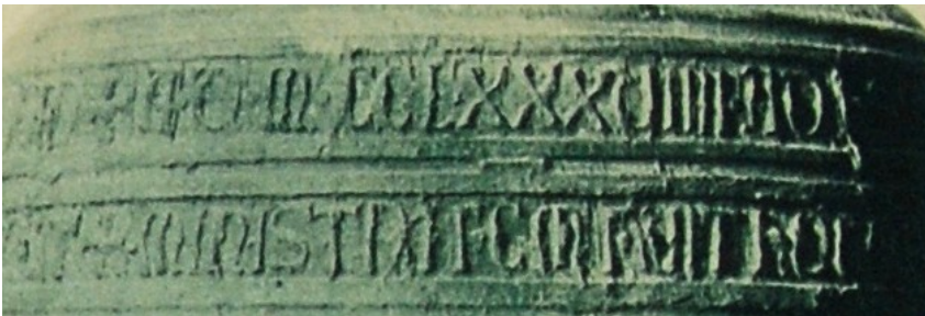
Esempio di caratteri gotici in campane medievali del Centro Italia del tipo presenti su molti prodotti dei Pisano

A maggior ragione è sorprendente pensare che quella campana possa essere, forse per via delle sue piccole dimensioni, “miracolosamente” scampata al sacco di Roma del 1084, avvenuto nel pieno della “lotta per le investiture” e durante il quale Roberto il Guiscardo fece grande scempio, distruggendo tutte le campane della Capitale 4 . Se si analizza l’epigrafe dal punto di vista paleografico 5 , guardando cioè al modo in cui sono realizzati i singoli caratteri della scrittura che la compongono, la questione assume un aspetto ancor più problematico e interessante. Nel 1069 in tutto il Sacro Romano Impero e nel Regno Franco, a seguito della riforma liturgica e grafica attuata da Carlo Magno, era ancora diffuso un tipo di scrittura equilibrata, di ampio respiro, con lettere che riprendevano la chiarezza e la regolarità dei caratteri delle scritture di Età Classica e Tardo Antica 6 . Tali caratteri, però, non sono nemmeno lontanamente assimilabili a quelli presenti, in giro, sulla spalla della campana in questione, che invece si presentano in una grafia minuscola, stretta, serrata e compressa sia lateralmente che verticalmente, dalle curve spezzate, e perciò non molto agevoli a leggersi. 7 Si tratta infatti di un tipico esempio di scrittura gotica epigrafica.