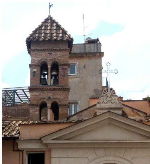
Il campanile di San Benedetto in Piscinula

In effetti, se ci si sofferma solo sul contenuto dell’iscrizione, preso “alla lettera”, si rimane colpiti dall’età del manufatto, che addirittura risulterebbe più antico del campanile e della chiesa stessi, datati tra la fine dell’XI sec. e gli inizi del XII 3 .